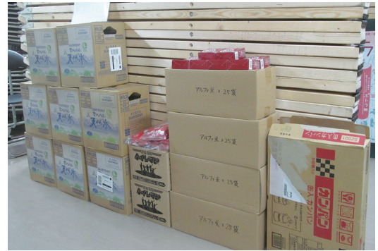
職員が3日間過ごすのに必要な備蓄品を用意

一斉帰宅抑制で職員が3日間過ごすために必要な備蓄品を用意。神様へのお供え物として、約60kg以上の米等の食料が常備されているため、万一、幼稚園の園児や保護者などを受け入れる状況となっても対応が可能となっている。