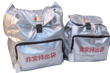
幼児ふたりを持つ社員と独身社員とはセットの大きさがこれだけ違う

特に女性に配慮したセット。清浄綿、ポリ袋、ポーチ、ディスポッシュ、ヘアゴム、ヘアピン、毛抜きピンセット、化粧水、美容液、クレンジングシート、生理用品