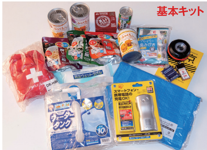
ブルーシート、ウォータータンク(10L)、多機能ラジオライト、防災用灯、折りたたみランタン白色系LED、単三乾電池(4本)、ペーパー歯みがき(5包)、防災ウェットタオル、救急セット巾着タイプ、災害用備蓄パン ふっくらパン、野菜一日これ一本(長期保存用)、えいようかん、梅じゃこご飯、わかめご飯、牛飯、

東日本大震災をきっかけに、自社で備える必要性を感じていた防災グッズの準備に着手。ホームセンター等の防災セットを調査すると、人によって必要ない物が入っていることがわかった。一方、防災グッズは社員のものだけでなく、家族分も備えることを当初から考えた。会社は社員がいて成り立ち、社員は家族がいて成り立つからだ。家族分の防災グッズは家族構成によって必要なものが変わってくる。社員や業者と相談し、「基本キット」とともに、「子ども向け」「高齢者向け」「女性向け」の3パターンを設定。こうして2015年に、家族構成に応じてカスタマイズした防災グッズができあがった。