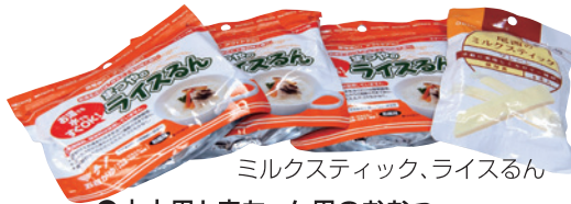
ミルクスティック、ライスるん