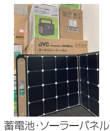
蓄電池・ソーラーパネル

災害は勤務時間に発生するとは限らない。また、自宅からリモートで業務をしていることもある。そこで、自宅で被災することを考慮し、一部社員にはポータブル電源やソーラーパネルを貸与してい