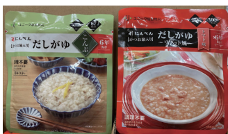
アレルギー対策用非常食 こんぶ&トマト味

アレルギーのある方向けに、アレルギー物質無しの非常食も揃えた。また、ベジタリアンの方でも食べられるよう、野菜のみの非常食も取り入れている。