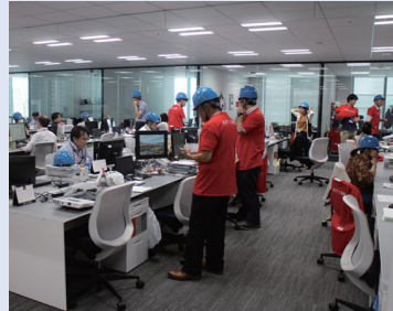
消防隊員はけが人の有無や電気関係を確認、消火器の使い方説明