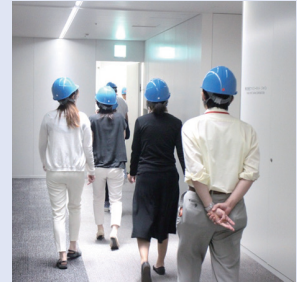
避難指示が出た場合は粛々と行動