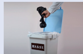
⑥便座にかいた袋を縛る ⑦可燃物として廃棄できる ⑧便器にかいた袋はかぶせたまま ⑨次に使用する方は④から繰り返し