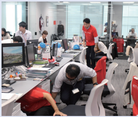
地震発生 デスクの下へ身を隠し、安全確保