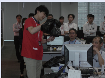
防災教育トイレの使用方法も説明する