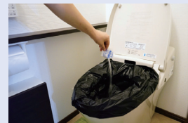
⑤用を足したら、薬剤(凝固、殺菌、消臭剤)を1袋振りかける