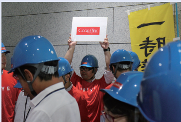
一時避難場所に集合・点呼