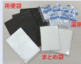
簡易トイレキット

簡易トイレキットの使い方を訓練時に説明している。1人につき1日8回分、3日間滞在の想定である。