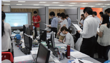
避難訓練後は臨場感が抜けないうちに災害教育