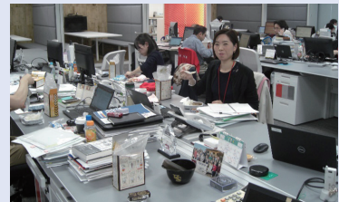
非常食も試食、訓練の日の昼食はみんなで非常食