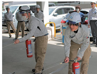
社員の誰もがいつでも消火活動ができるよう、徹底訓練