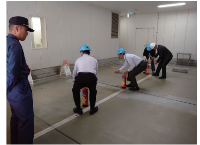
自衛消防に関する訓練の様子

各フロア単位で自衛消防隊地区隊を組織、複数班の体制で災害発生に備えているが、人事異動があった際の変更の届出やメンバーの周知に課題があった。そこで、変更届をワークフローのメニューに加えたことで定着が進んだ。