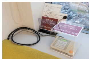
館内放送セットのマイク