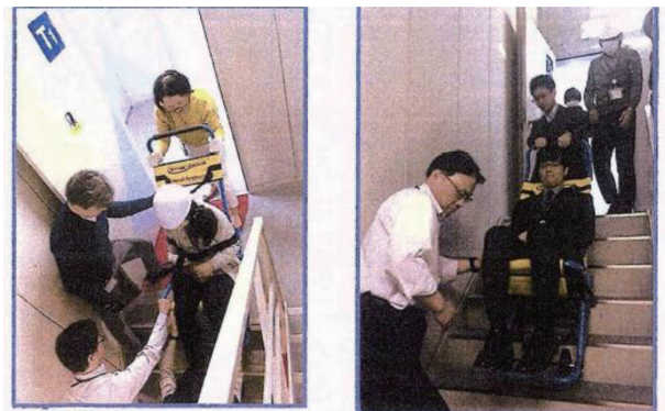
階段避難車イーバックチェア