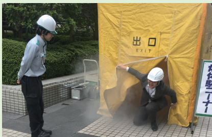
煙体験コーナーの様子

所在するビルの防災訓練には毎年社員が参加。火災時の煙体験や消火器体験など、災害時に発生する可能性があるさまざまな状況を体験できるコーナーを通して防災意識の向上を図っている。