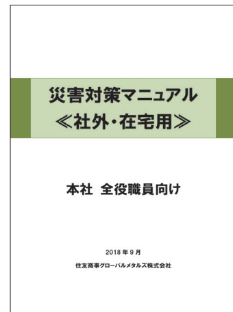
災害対策マニュアル<社外・在宅用>