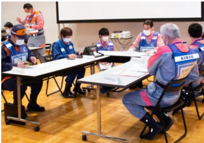
災害対策本部の運営 【北とぴあ】