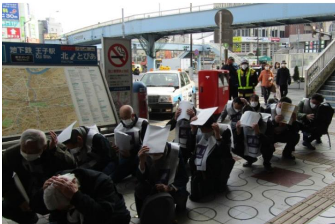
シェイクアウト訓練 【王子駅 (JR)】