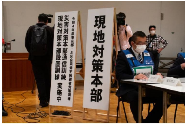
現地对策本部の運営 【北とぴあ】