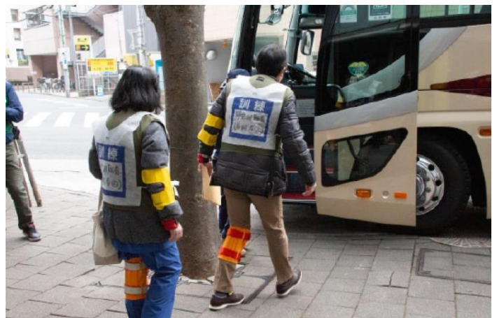
バスによる要配慮者の搬送 【王子駅⇒埼玉県】