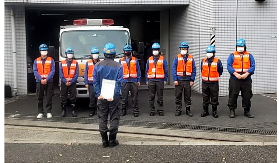
1月3日9時出発式（東京都水道局西部支所）